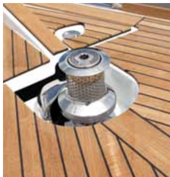
Powerful windlass with double anchor rollers / Guindeau puissant avec double davier