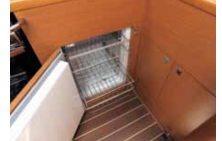
300L fridge/freezer with pull out drawers / Réfrigérateur/freezer 300L avec tiroirs coulissants