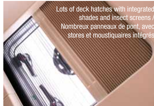
Lots of deck hatches with integrated shades and insect screens / Nombreux panneaux de pont, avec stores et moustiquaires intégrés