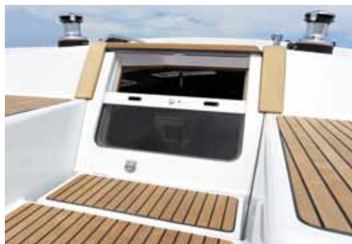
Sliding companionway hatch / Porte de descente coulissante