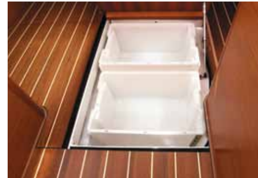
Full featured galley with underfloor storage / Cuisine équipée complète avec rangements sous les planchers