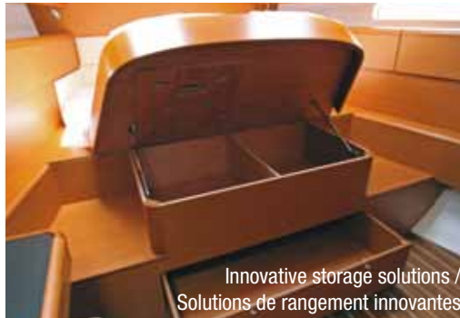
Innovative storage solutions / Solutions de rangement innovantes