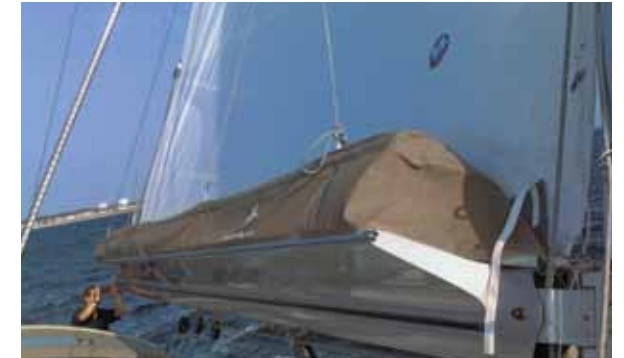
Park Avenue boom / Bôme Canoë