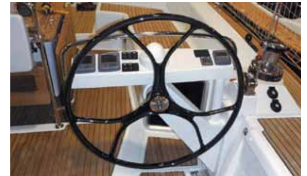
Carbon steering wheels / Barres à roue carbone