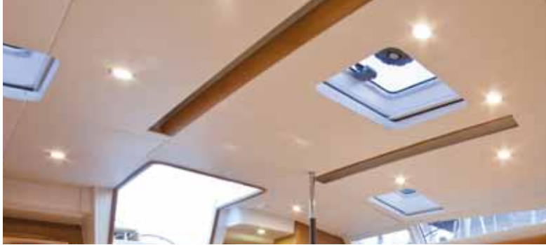
LED lighting / Eclairage LED