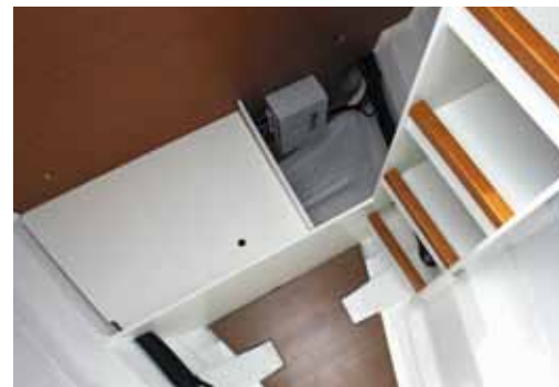
Forward sail locker / Soute à voile