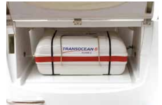
Dedicated liferaft locker with easy deployment / Coffre à BIB dédié avec mise à l'eau facile