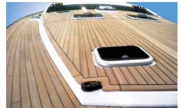
Full teak deck and coachroof / Pont et roof entièrement lattés teck